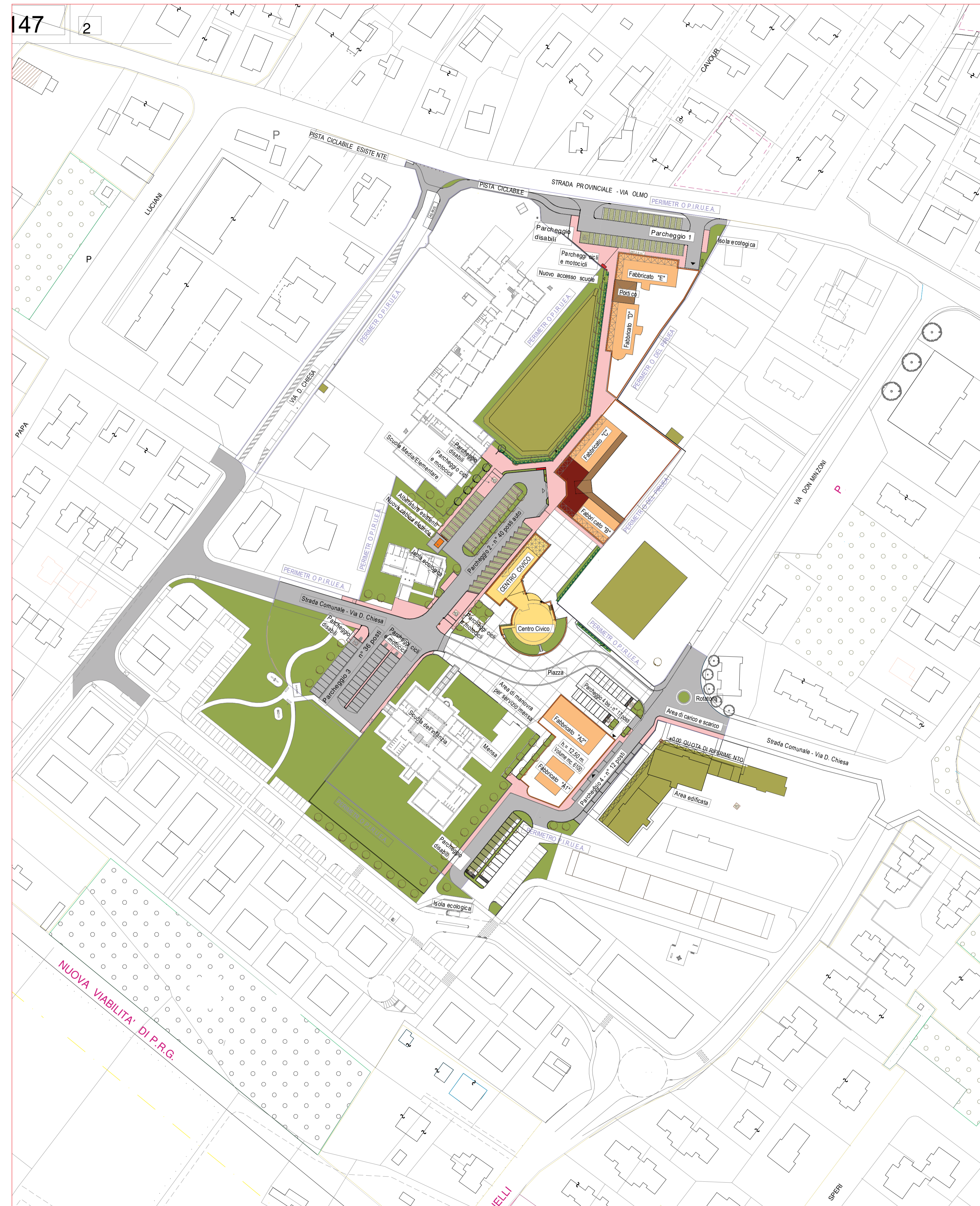
PLANIMETRIA GENERALE SCALA 1:1000

COMUNE DI MARTELLAGO (Provincia di Venezia)