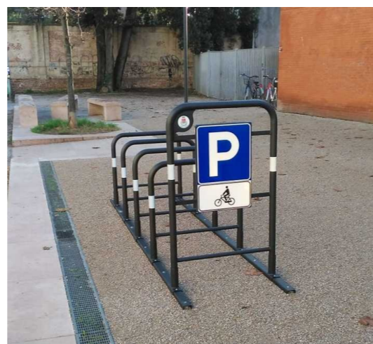
ESEMPIO DI RASTRELLIERA ANTI-TACCHEGGIO