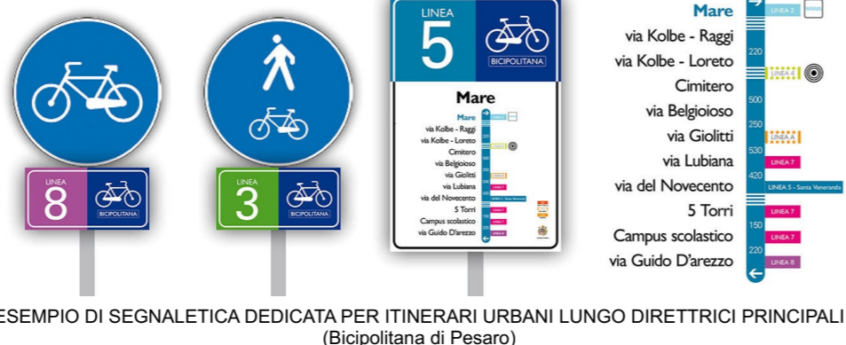
ESEMPIO DI SEGNALETICA DEDICATA PER ITINERARI URBANI LUNGO DIRETTRICI PRINCIPALI (Bicipolitana di Pesaro)