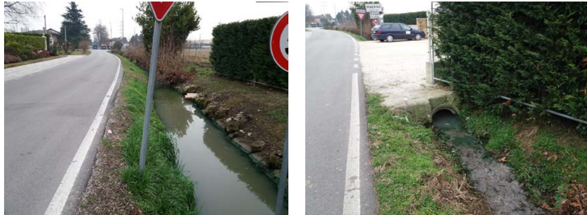
Via Cavino: ristagni d'acqua.