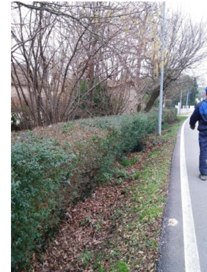
Via Cavino: ristagni d'acqua e sezione fossato insufficiente