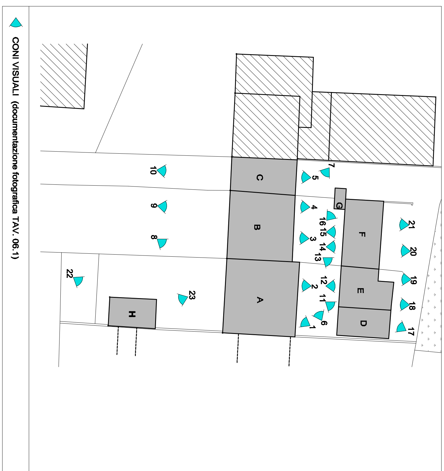
CONTI VISUALI (documentazione fotografica TAV. 06.1)