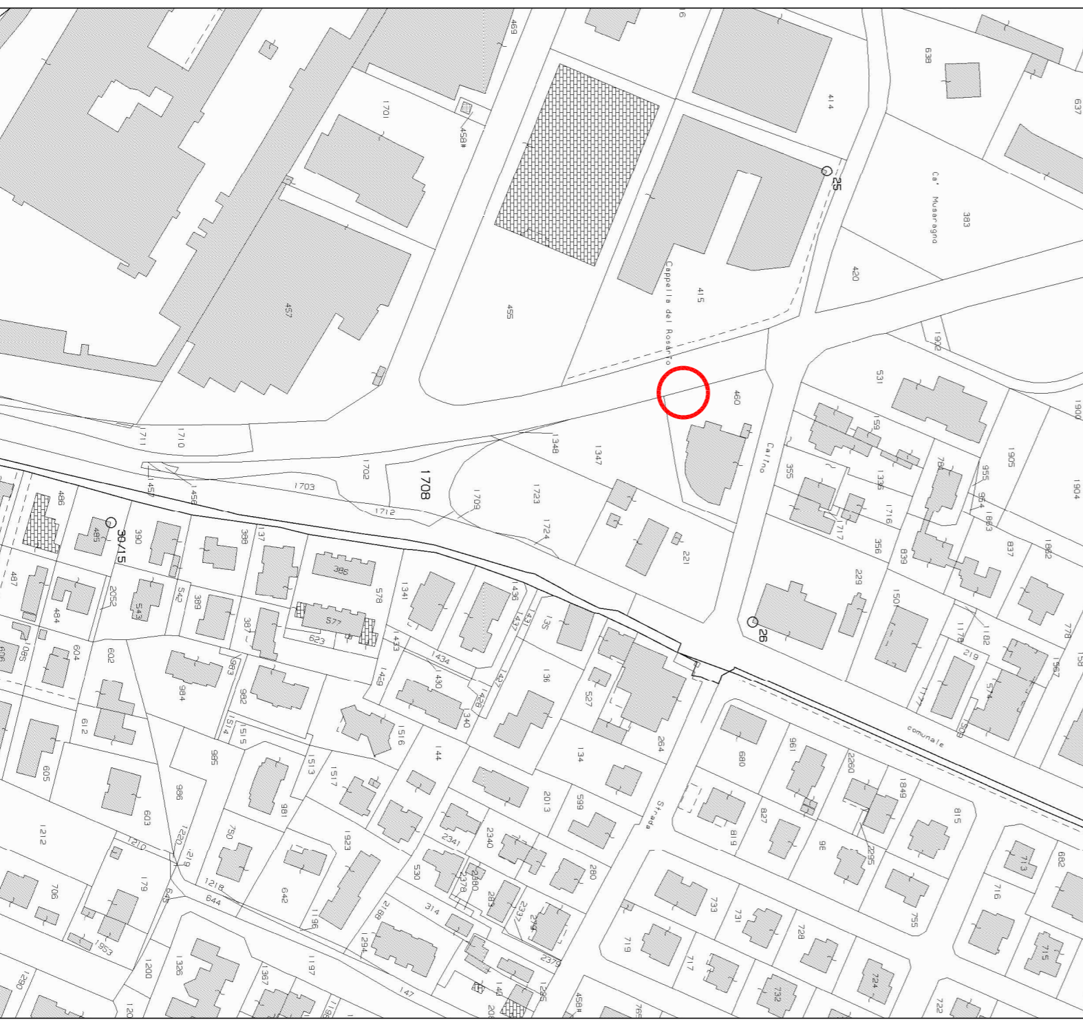
ESTRATTO MAPPA COMUNE DI MARTELLAGO (VE) FOGLIO 1.4 - MAPPAU 4/60 SCALA: 1:2.000