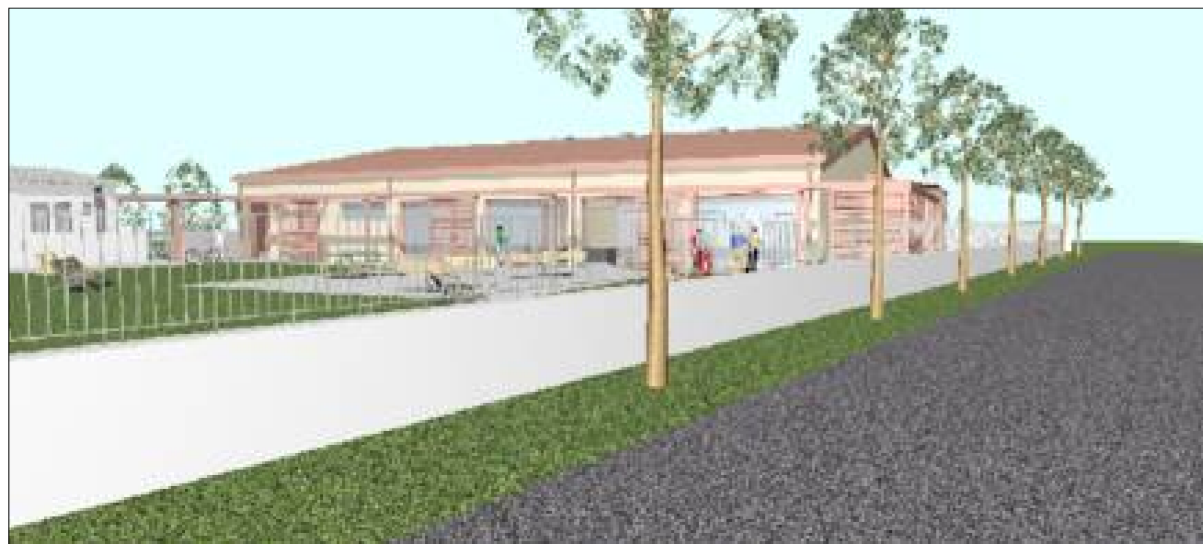
VISTA SUD OVEST