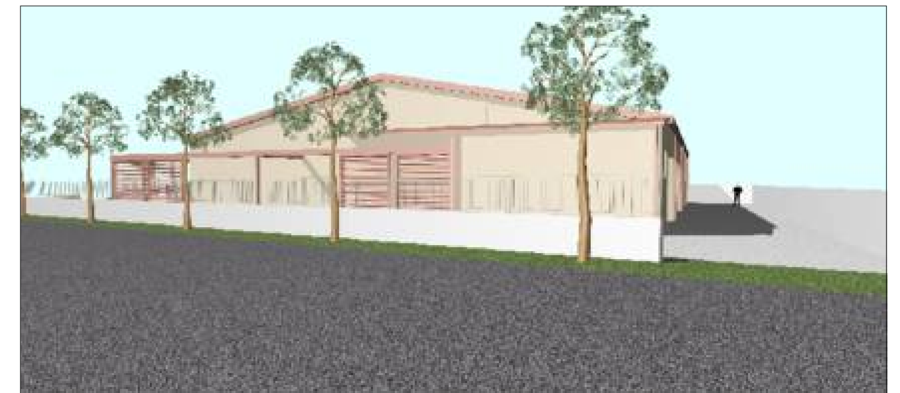
VISTA SUD EST