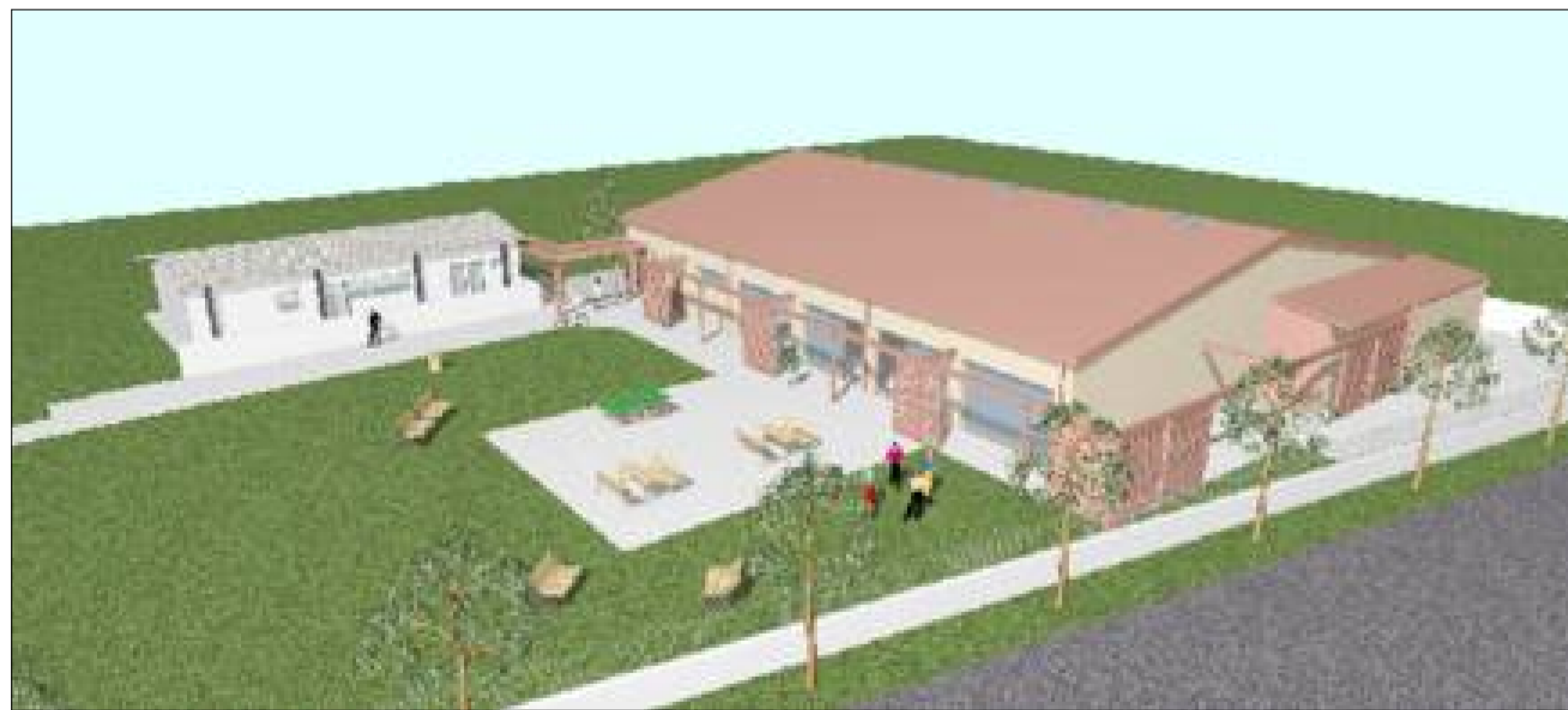
VISTA SUD OVEST