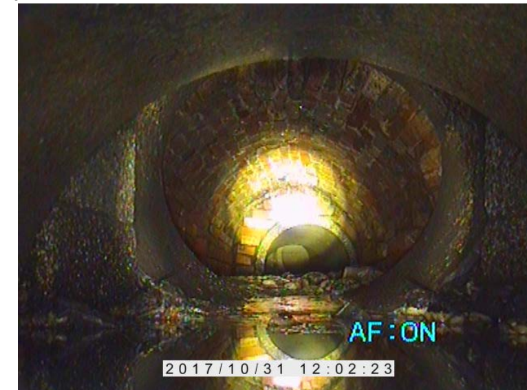
Videoispezione dell'attraversamento stradale

generale: di seguito si riporta una foto (pozzetto a sud della strada con vista verso nord) dove è possibile apprezzare la presenza di un vecchio ponte in mattoni e le tubazioni contigue ma non correttamente raccordate.