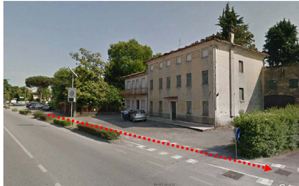
Ipotesi di collegamento con dorsale principale presente verso ovest

Gli interventi necessari consistono primariamente in una idropulizia dell'attraversamento stradale esistente con una successiva videoispezione accurata (tramite robot) che verifichi lo stato di conservazione dell'attraversamento e la presenza di eventuali cedimenti o soglie che ne riducono la funzionalità; successivamente sarà necessario provvedere ad una idropulizia di tutta la condotta presente lungo via Mazzini (fognatura mista). Per risolvere l'insufficienza della rete posta a valle dell'attraversamento è stato individuato come necessario il collegamento tramite un nuovo tratto di condotta di diametro 80 cm con la condotta principale presente verso ovest (probabilmente costituisce il tombinamento del fosso di guardia di una vecchia strada interpodereale rilevabile nelle mappe catastali d'impianto).