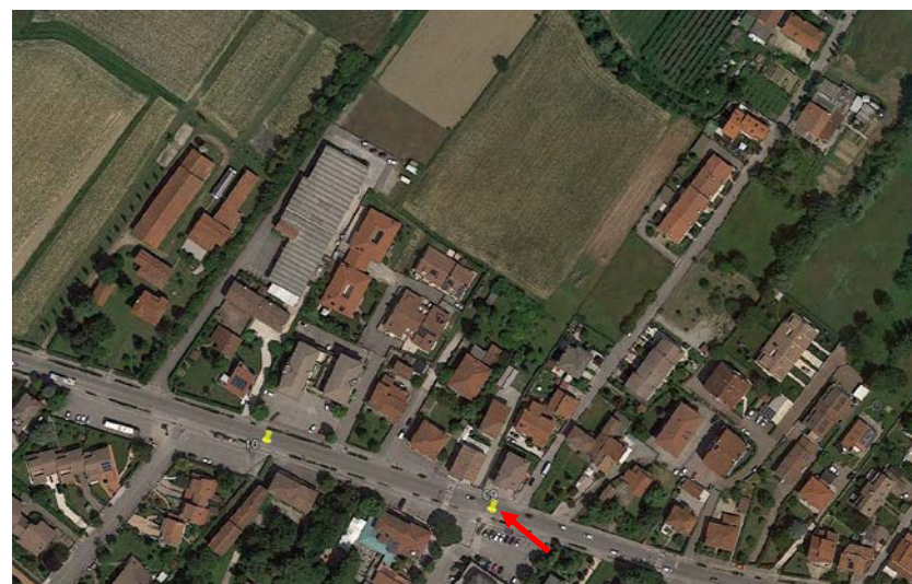
Posizione della videoispezione effettuata

Inoltre le videoispezioni effettuate hanno mostrato come l'attraversamento stradale esistente in corrispondenza di via Papa Luciani sia in condizioni non ottimali, probabilmente a causa degli interventi di allargamento stradale succedutesi negli anni senza un organico intervento di rifacimento