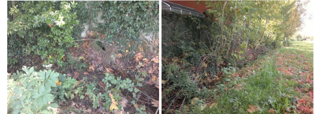
Stato di conservazione delle affossature presente nell'angolo sud-est

La rete esistente è evidentemente sottodimensionata e le affossature versano in un cattivo stato di manutenzione; pure i tombinamenti che ricevono gli apporti delle aree sono parzializzati nella sezione a causa di materiale di deposito.