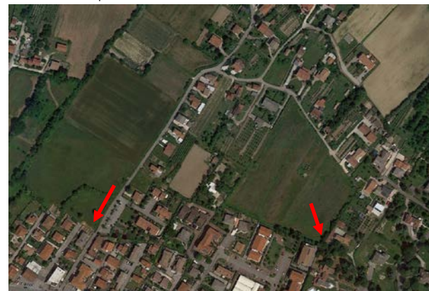
Posizione dei due recapiti dell'area

La rete di drenaggio non è organicamente sviluppata ma si compone sia di tratti di condotte che di affossature che vanno a scaricare sostanzialmente in due punti: il tombinamento sul lato ovest di via Matteotti presente all'estremo sud e un tombinamento presente sull'angolo sud-est che successivamente, passando tra edifici, anche a cielo aperto, arriva fino all'attraversamento di via Olmo.