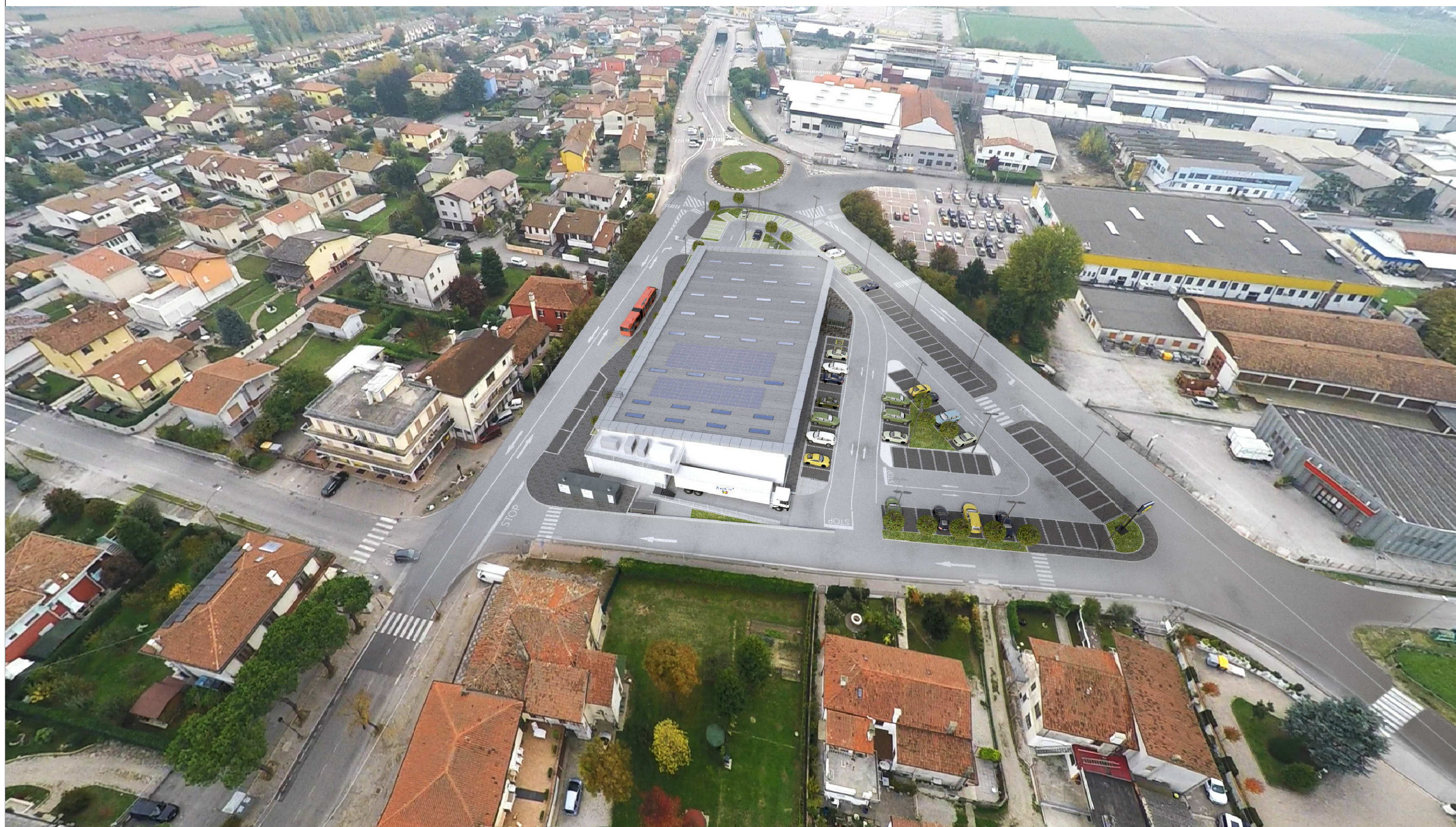
FOTOMONTAGGIO - Vista da Nord