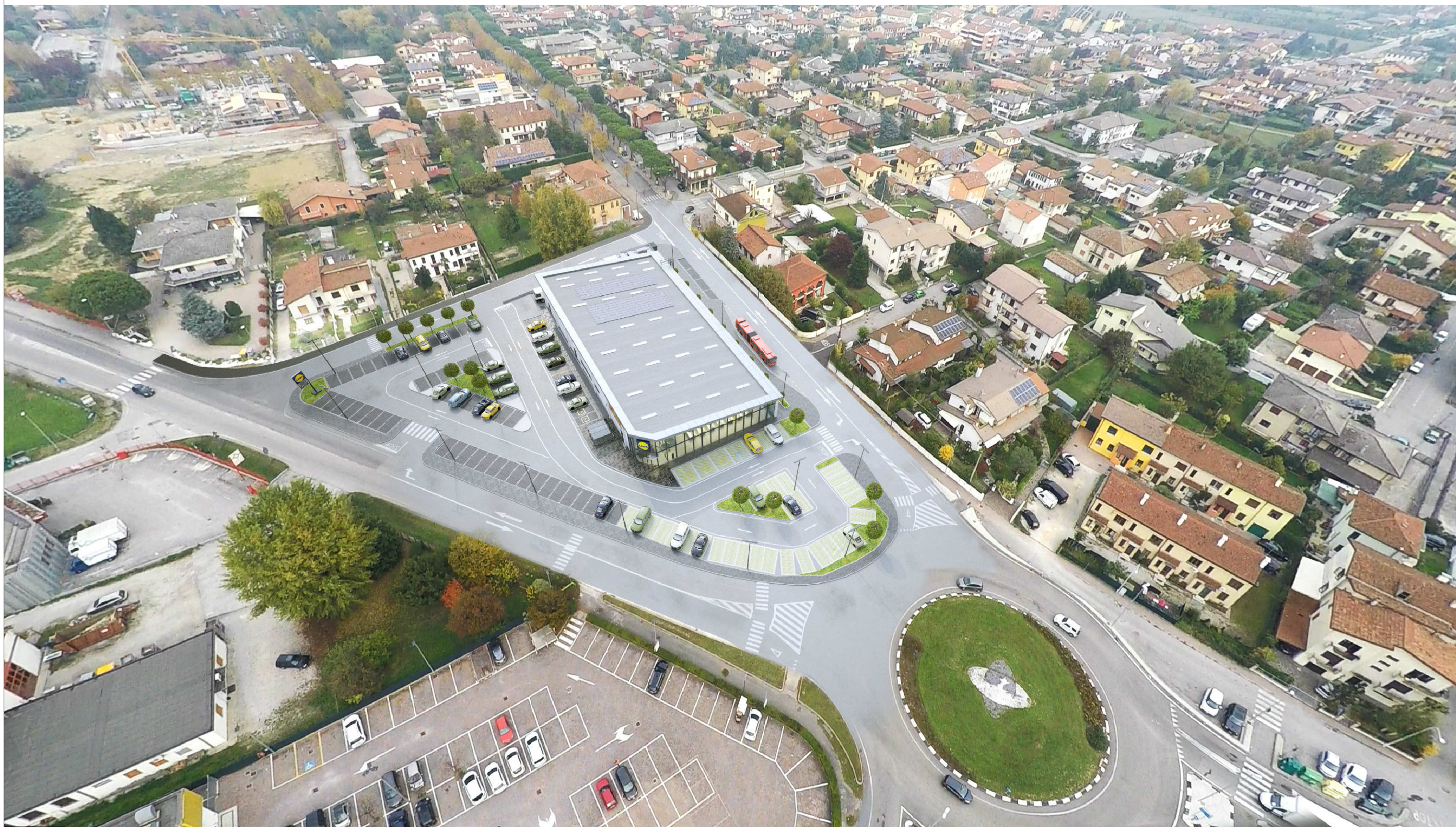
FOTOMONTAGGIO - Vista da Sud Ovest