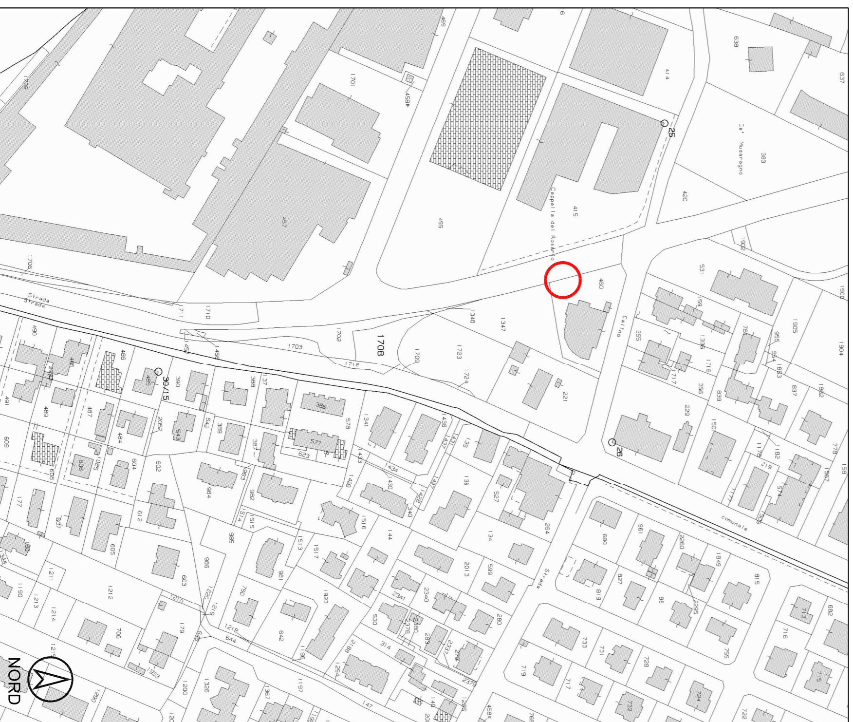
ESTRATTO MAPPA COMUNE DI MARTELLAGO (VE) FOGLIO 14 - MAPPA 460 SCALA 1:2.000